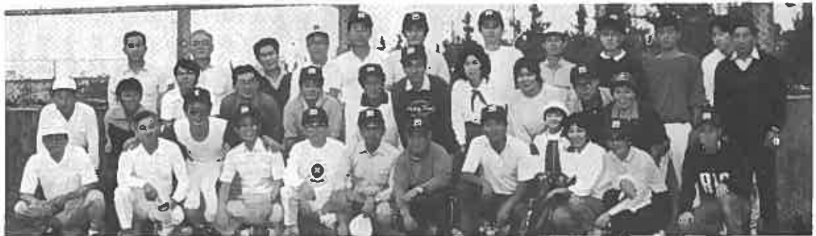
調布三田会対調布稲門会ソフトボール親善大会 (於関東村)