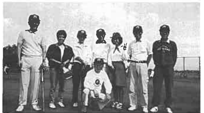
→ 早稲田の選手 ← 慶応の選手