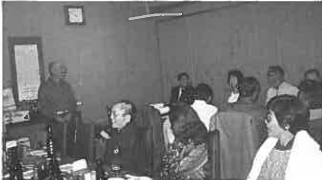
←パーティーは異趣同舟

面の方よりたくさんのお品が寄贈されました。又運営上数多くの人達の協力がありここに厚く御礼申し上げます。 競技成績と賞品を寄贈された方々は左記の通りです。