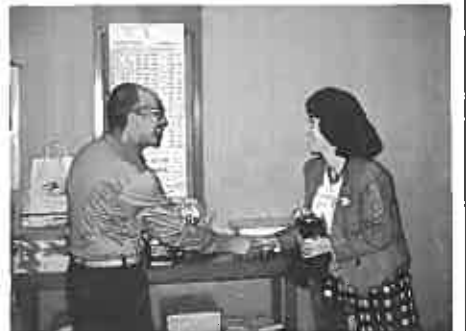
優勝カップは林会長より