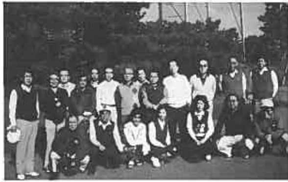
→スタート直前全員集合

面の方よりたくさんのお品が寄贈されました。又運営上数多くの人達の協力がありここに厚く御礼申し上げます。 競技成績と賞品を寄贈された方々は左記の通りです。