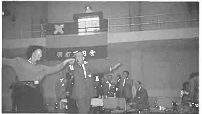
ダンスを披露する小津会長

第二回調布三田・稲門親睦ゴルフコンペが、七月二十七日(日)、絶好の天気に恵まれて、桜ヶ丘カントリークラブにおいて開催されました。当日の参加者は、三田会七名、稲門会十三名の合計二十名、うち女性の参加が四名でした。二回目ということもあって、スタート前のなごやかな挨拶風景があちこちで見受けられ、リラックスした雰囲気の中にアウトコースよりスタートしました。真夏の日射しのなかで、汗をふきながらのハーフを終えた後は、食堂で冷えたビールが待っていました。