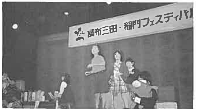
紙ヒコキをたのしむ子供達