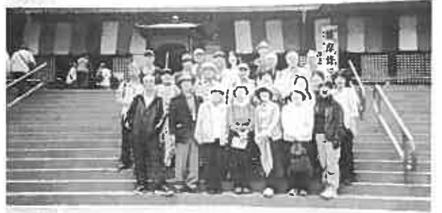
川越の喜多院にて

築された「家光誕生の間」、「春日局化粧の間」、樹々草花が見事な奥庭、表情や仕様が面白い五百羅漢等を見学。歴史や植物に造詣の深い方々に