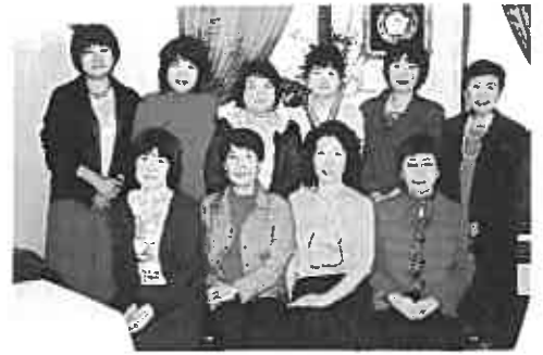
10/30 第1回食・歩会(原宿ルセーナ館)

美味しいものを、一緒に食べに行きませんか？ お一人でも気楽に参加出来ます。皆様のご入会を心待ちにしております。