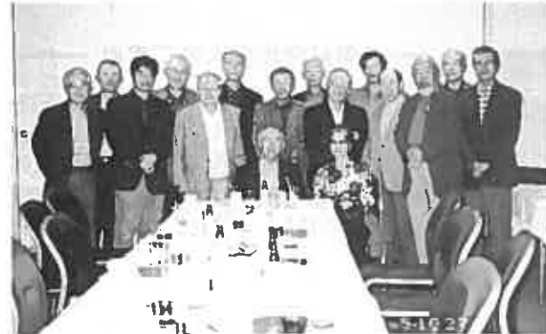
10/27 早慶戦後の懇親パーティ(大月CC)

昨シーズンは3月31日にお花見を兼ねて近場の川崎国際で単独のコンペを、早慶戦は5月12日武蔵野で開催しました。秋の単独のコンペは残念ながら幹事の事故によりお休み、早慶戦を10月27日大月CCで行いました。早慶戦の成績は残念ながら2連敗、今年の巻き返しを図りたいものです。参加者は女性会員を含め15名前後、早慶戦で約25名