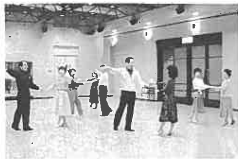
12/18 ルンバを踊る(むらさきホール)

社交ダンスは、スポーツに芸術的要素を加味し、①年令に関係なく楽しめる趣味として②美容と健康を増進するものとして③生涯学習として④地域社会に貢献するものとして、今多くの方々が踊っています。ブルース、ジルバ、ワ